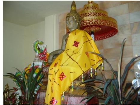
ภาพแสดง พระพุทธรูปศิลา(หิน)