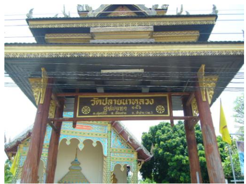
ภาพแสดง ที่ตั้งของวัดปลายนาหลวง เลขที่ 156 หมู่ที่ 7 ต.ทุ่งกว้าว อ.เมืองปาน จ.ลำปาง