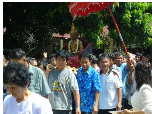
ภาพแสดง งานประจำปีบ้านปลายนาหลวง การแห่พระศิลา(หิน)