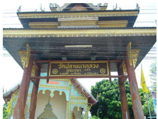
ภาพแสดง ที่ตั้งของวัดปลายนาหลวง เลขที่ 156 หมู่ที่ 7 ต.ทุ่งกว้าว อ.เมืองปาน จ.ลำปาง