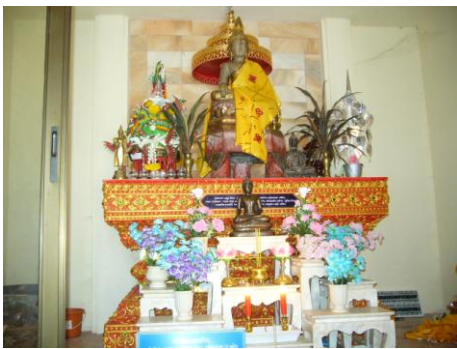
ภาพแสดง พระพุทธรูปศिला(หิน)

สมโภชน์แล้วก็ได้อัญเชิญพระกลับไปเช่นนี้ทุกๆปี ครั้งเมื่อเหตุการณ์บ้านเมืองเป็นปกติสุข ชาวบ้านชาวเมืองไม่เคียดรื้อนด้วยน้ำฟ้าสายฝนแล้วท่านเจ้าหลวงผู้ปกครองนครจึงทรงอนุญาตให้นำพระกลับวัดเดิมคือ วัดปลายนาหลวง ส่วนวัดปลายนาในเมืองเมื่อพระพุทธศिलाไม่ได้ไปประดิษฐานอยู่จึงกลายเป็นวัดร้าง ชาวบ้านจึงแผ้วถาง ตั้งบ้านเรือนอยู่แทนที่ปัจจุบันนี้คงเหลือแต่ป้ายบอกให้รู้ว่า “ตروقปลายนา” เป็นอนุสรณ์เท่านั้น ด้วยความเชื่อมั่นศรัทธาในพุทธานุภาพและอภินิหารแห่งพระพุทธศिला (พระเจ้าหิน) ชาวบ้านปลายนาและศรัทธาสาธุชนทั้งใกล้ไกล ครั้งเมื่อถึงเดือน 8 เหนือขึ้น 15 ค่ำ(เดือน 6 เพ็ญ) ของทุกๆปี จะเป็นวันสงกราน้ำพระพุทธศिला และสมโภชน์เป็นประเพณีประจำปีทุกปี