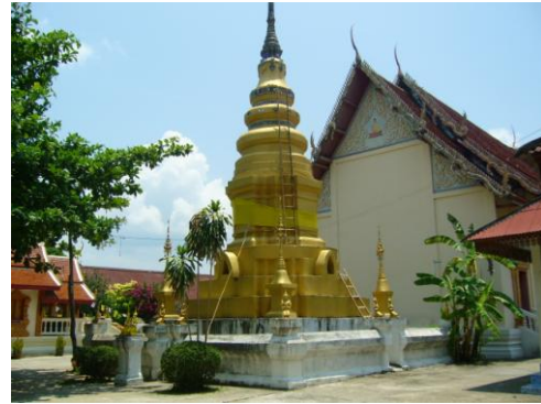
ภาพแสดง เจดีย์ภายในวัดปลายนาหลวง