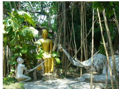
ภาพแสดง โบราณวัตถุ และโบราณสถาน และบรรยากาศภายในวัดปลายนาหลวง